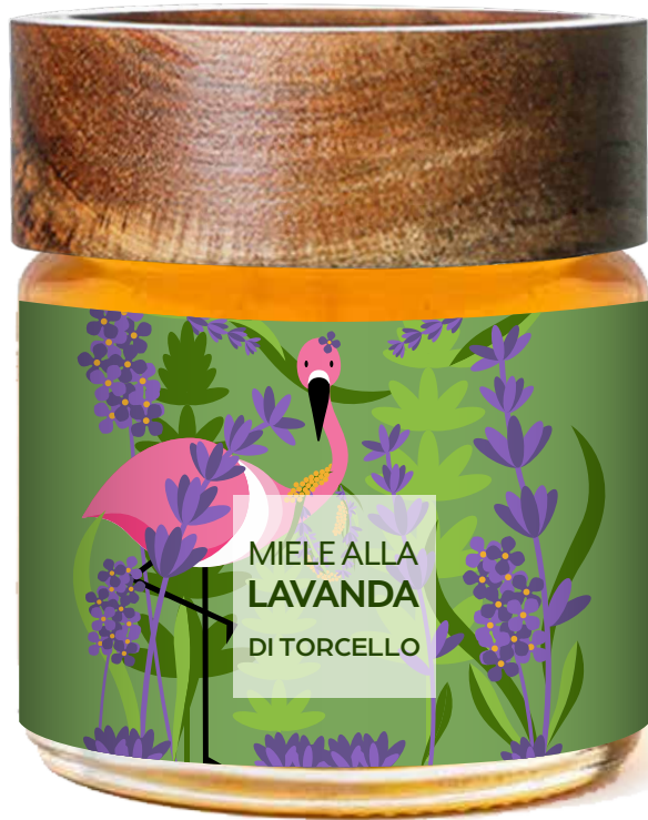
Miele di Lavanda di Torcello