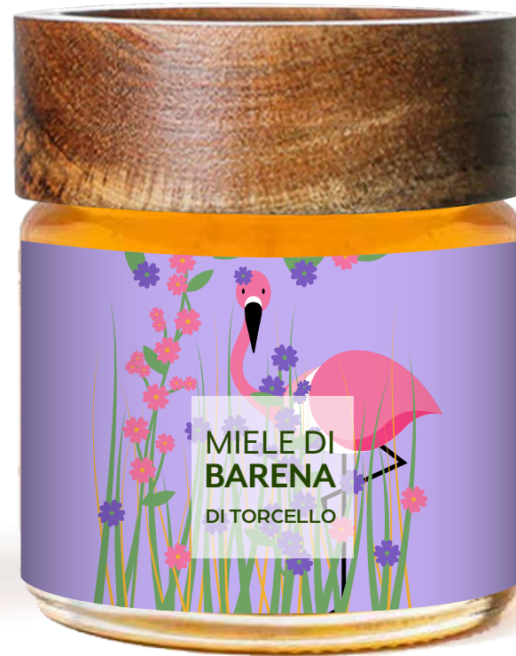
Miele di BARENA Limonium di Torcello