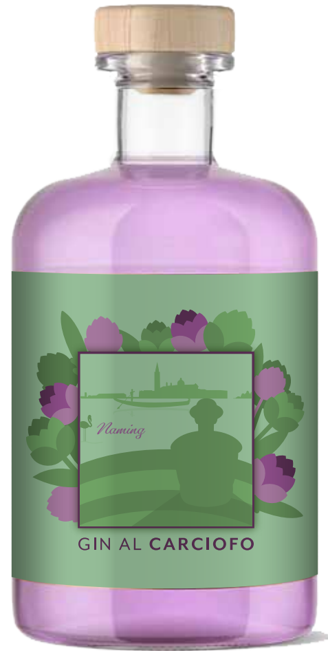
Gin al Carciofo di Torcello