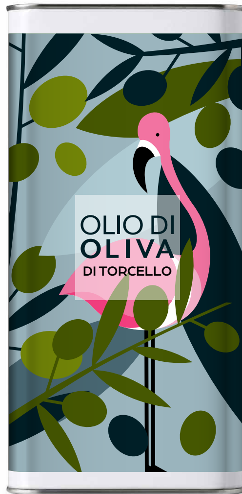
Olio Extra Vergine di Oliva di Torcello