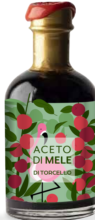
Aceto di Mele di Torcello 20 Anni