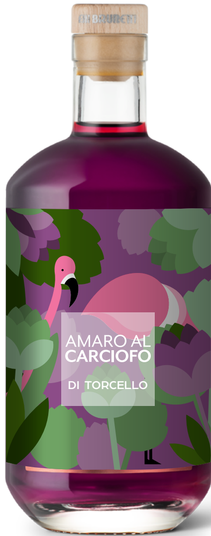
Amaro al Carciofo di Torcello